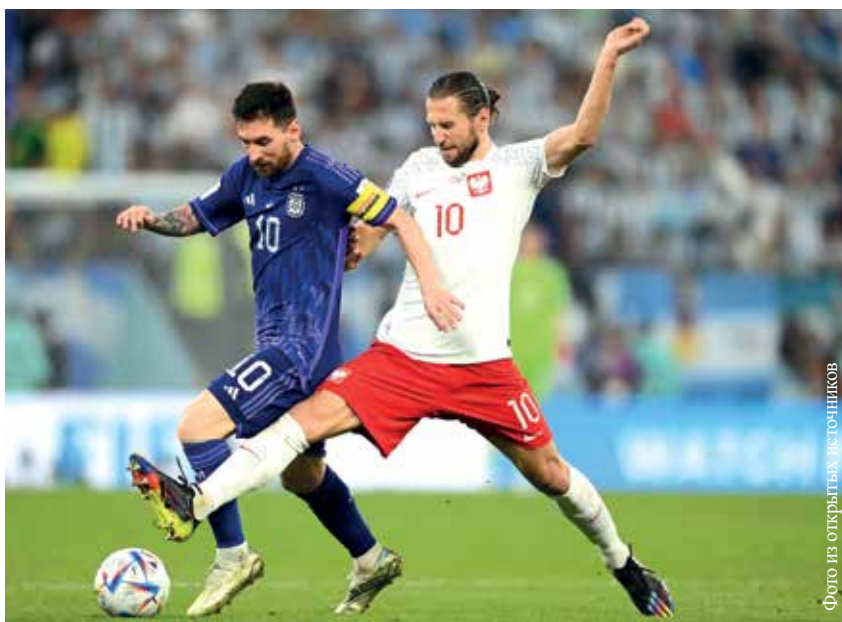
Фото из открыток историков

поединка аравийцы размочили счет, оформив вторую путевку в плей-офф полякам. Много дифирамбов перед началом мундиаля пелось в адрес сборной Бельгии (группа «F»). «Красные дьяволы» в компании оппонентов из Хорватии, Канады и Марокко как минимум причислялись к дуэту фаворитов. Как-никак, а на предыдущем ЧМ-2018 в России бельгийцы завоевали бронзу, а хорваты серебро. Если брать в расчет отборочный турнир к планетарному первенству в Катаре, то команда испанского специалиста Роберто Мартинеса оказалась едва ли не единственной из 55 коллективов «Старого Света», которая в своей группе «Е» в восьми поединках не потерпела ни одного поражения при шести викториях и двух ничьих. Возможно, что этот факт