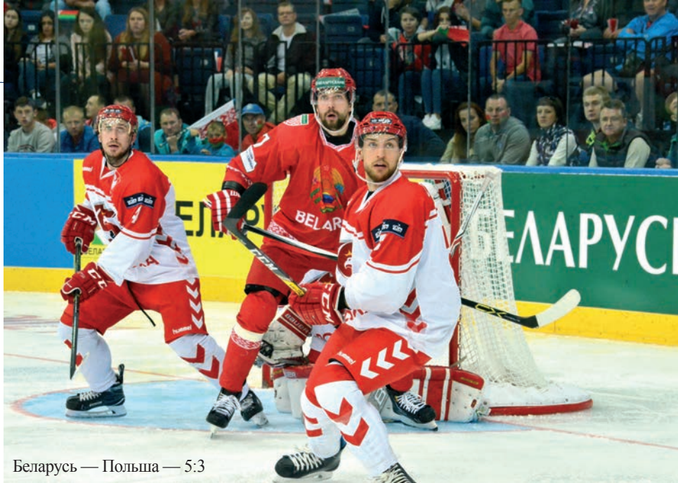
Беларусь — Польша — 5:3

Бесспорно, что достойный результат был на повестке дня национальной сборной Беларуси ФХБ и сейчас. Но он рассматривался с позиции проигрыша белорусов сборной Словении в предыдущей олимпийской квалификации в феврале 2013 года. Тогда, в датском Войенсе, тоже все мысли были направлены на игру с мнимым фаворитом турнира — командой Дании. А вышло совсем иначе — наша команда под руководством Андрея Скабелки проиграла словенцам 2:4 и утратила надежды на Олимпиаду-2014 в Сочи. После той игры