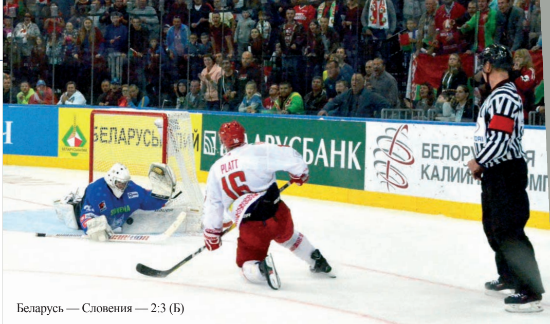
Беларусь — Словения — 2:3 (Б)

Еще одной из проблем в белорусском хоккее, по мнению Президента, является низкая мотивированность игроков из-за низкой конкуренции в команде. Поэтому большое внимание необходимо уделять подготовке резерва. Глава государства также подчеркнул, что кадры в спорте решают все, они должны видеть все недостатки и не скрывать их. «Я уже поручил серьезное внимание обратить на кадры, которые сегодня заняты в спортивной индустрии, особенно в хоккее, потому что это очень популярный, можно сказать, национальный вид спорта вместе с футболом и самый массовый. Вы видите, как зрители воспринимают все это», — заметил