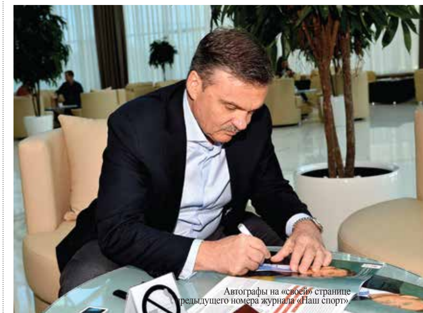
Автографы на «своей» странице предыдущего номера журнала «Наш спорт»

– Главное и первое, что приходит на ум – это люди! Добрые, отзывчивые, дружелюбные. Знаете, первый раз я посетил Минск в далёком 1981 году в качестве хоккейного лайнсмена. Ещё тогда мне в душу запала доброта и открытость белорусов. Прошло более трёх десятков лет, а ваши люди